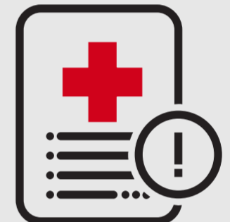
Allergie à l'aspirine ou avis contraire d'un dispensateur de soins