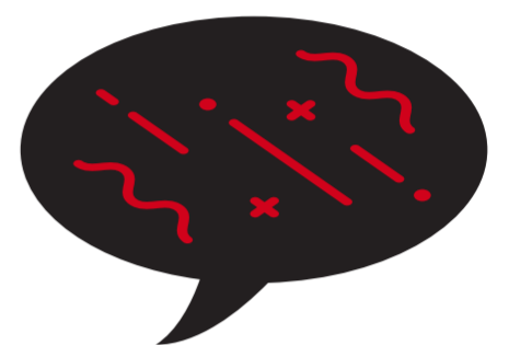
Trouble de la parole