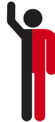
Faiblesse d'un bras ou d'un côté